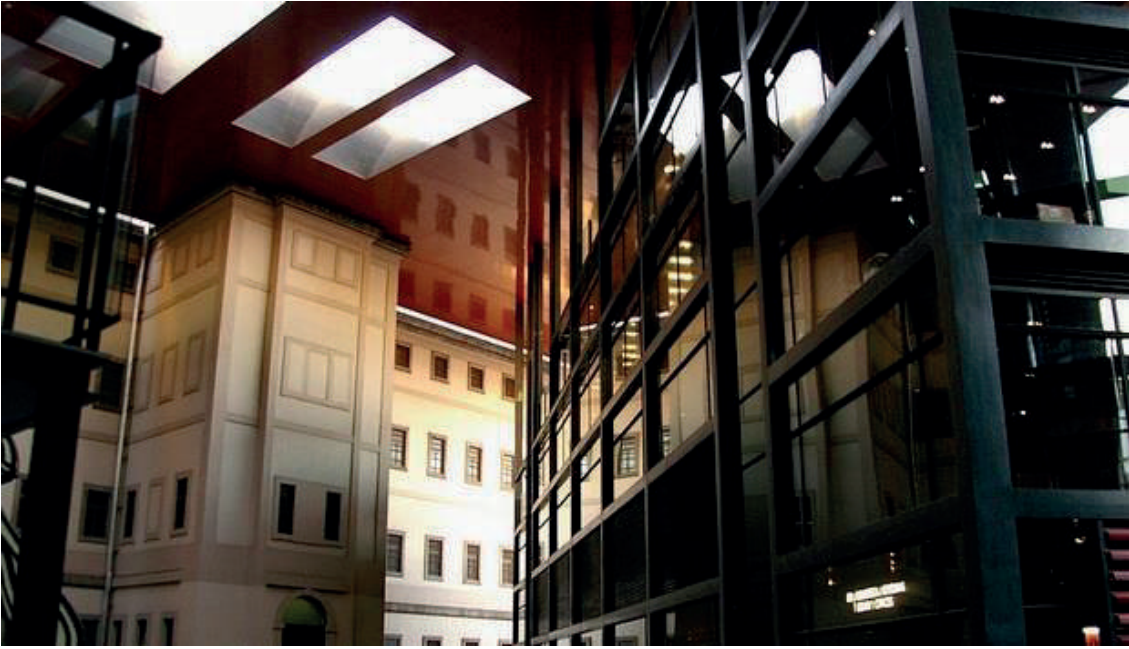
Imagen 3. AMPLIACIÓN por Jean Nouvel de Museo Reina Sofía, Madrid, España.