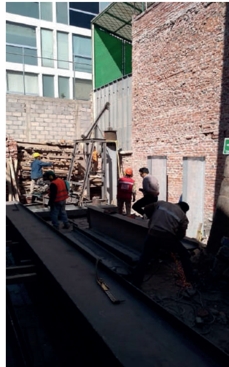
Imagen 12. Proceso de obra para hincado de pilotes metálicos, Condominio Querétaro #121.