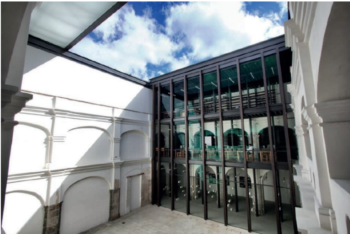
Imagen 7. Centro Cultural San Pablo, Taller Arquitectura Rocha Carrillo, 2009.

El uso del monasterio sería de tipo cultural, por lo que aun con los espacios recuperados, las áreas fueron insuficientes para cubrir el programa arquitectónico. Como solución a esta problemática, los arquitectos propusieron una estructura metálica ligera y reversible en el lado oriente del complejo, desarrollada en tres niveles. Dicha estructura alberga actualmente la biblioteca del complejo, así como un área cubierta para exposiciones.