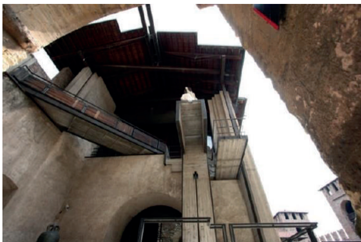
Imagen 6. Vista inferior pasarela estatua de Cangrande della Scala, Museo de Castellvecchio, Scarpa,