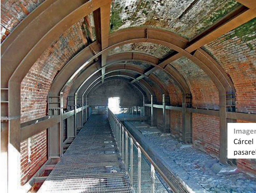
Imagen 2. Almacén de Pólvoras de la Ex Cárcel de Valparaíso en Chile, con vigas, pasarelas y refuerzos estructurales.