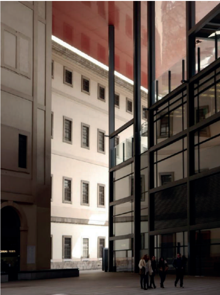
Imagen 4. Ampliación de Museo Reina Sofía, Madrid, España.