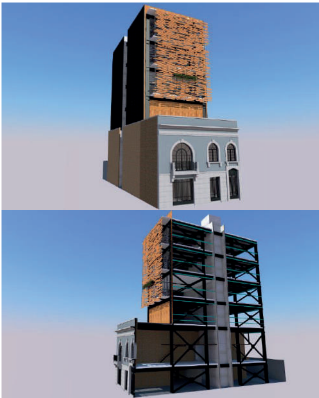
Imagen 10 y 11. Modelos 3D Condominio Querétaro #121.

El proyecto está diseñado con un sistema de marcos rígidos de acero con arriostramiento lateral conformado por contravientos, estructura que se integra al interior de la preexistencia, anclando a través de vigas de acero la fachada catalogada.