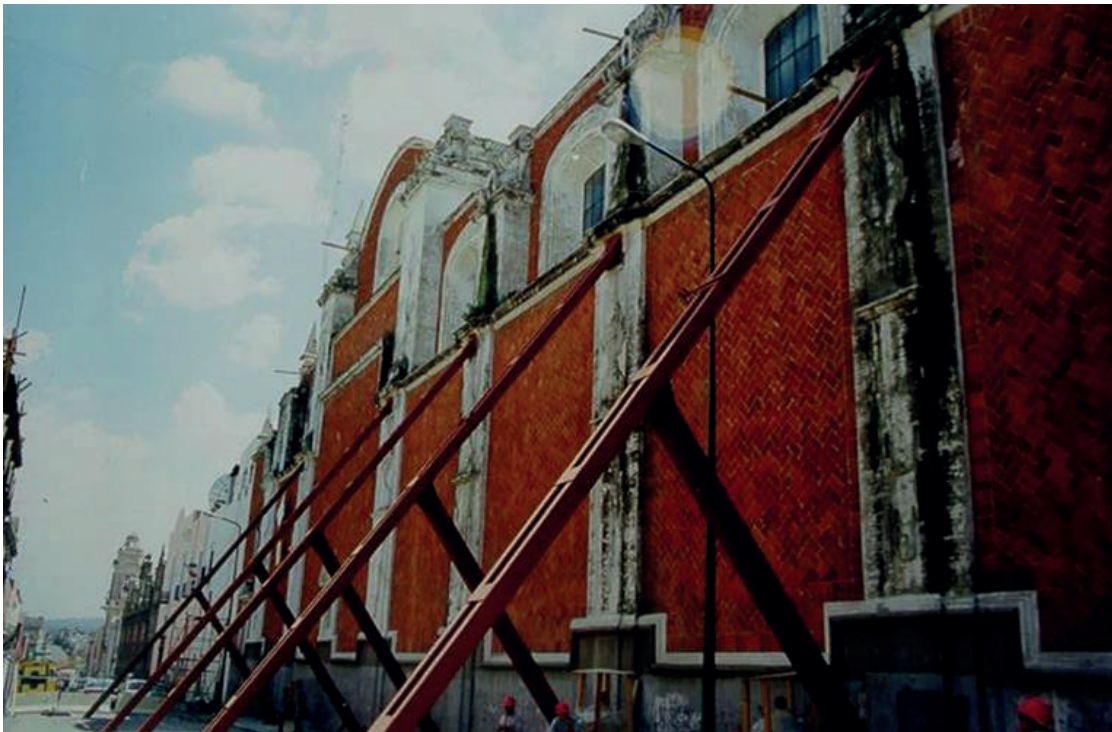
Imagen 1. Apuntalamiento de acero de la fachada norte del Templo de la Compañía de Jesús, Puebla, 1999.